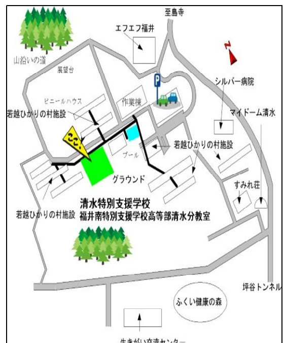
若越ひかりの村周辺地図